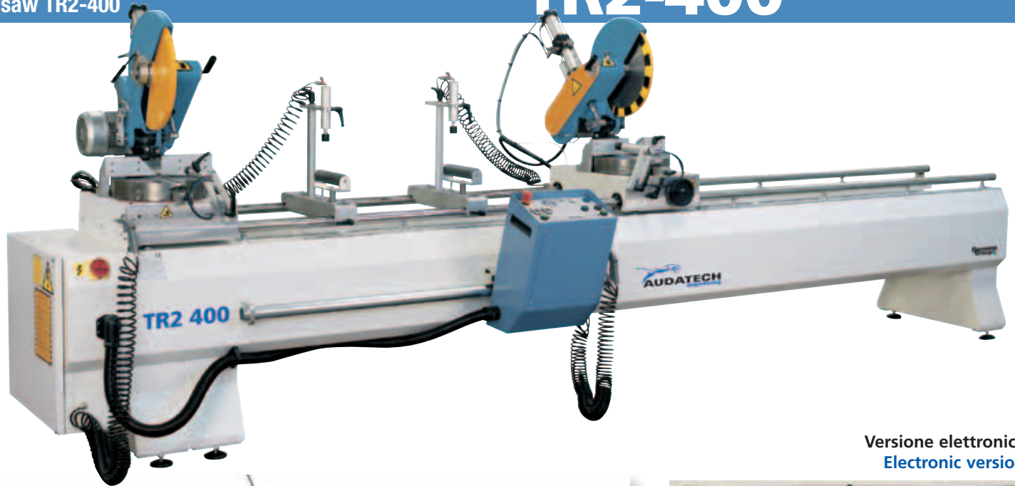
Versione elettronica Electronic version